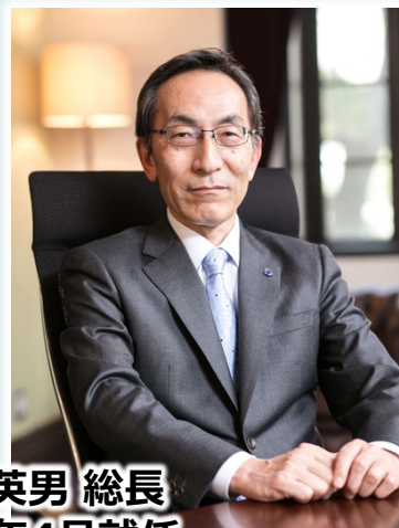
大野 英男 総長 2018年4月就任